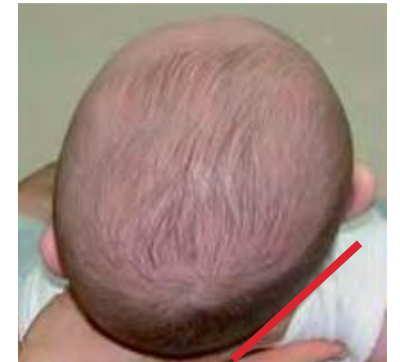
Plagiocefalia posicional